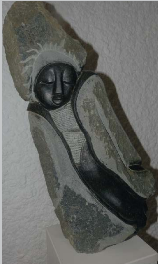
Walking in the Wind Gegen den Wind