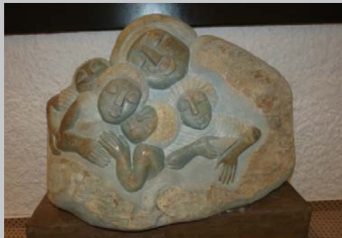
Mother Care Mutterliebe