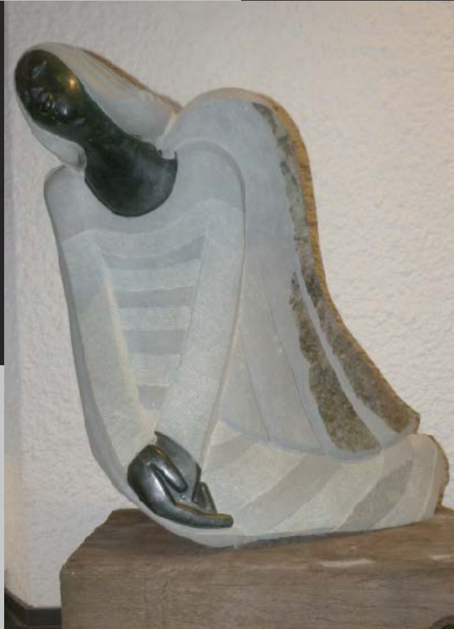
The Angel of Peace Der Engel des Friedens