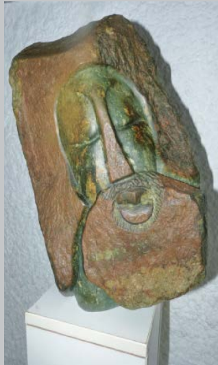
Man of Wisdom Weiser Mann