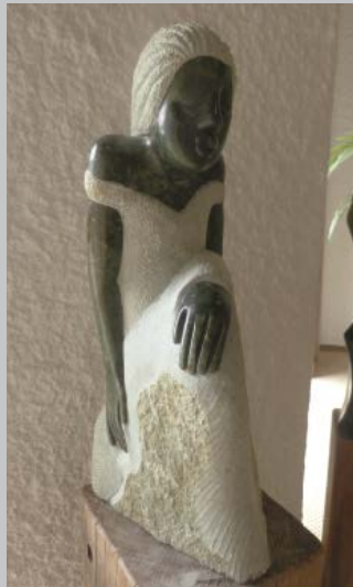
The Wondering Woman Die nachdenkliche Frau