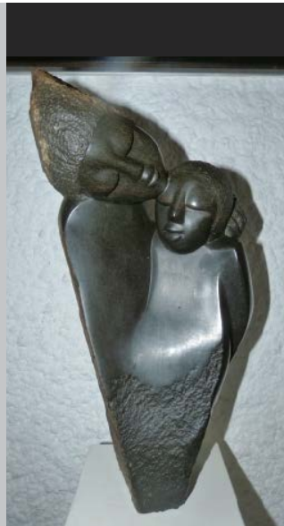
The Comforter Der Tröster