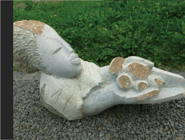
The Giver Freigiebig