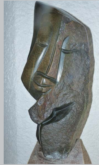
Young and Old – or: The Seasons of Life Jung und Alt – oder: Die Jahreszeiten des Lebens