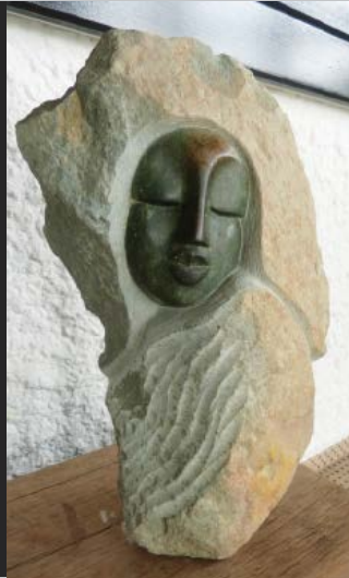
Still waiting Abwartend