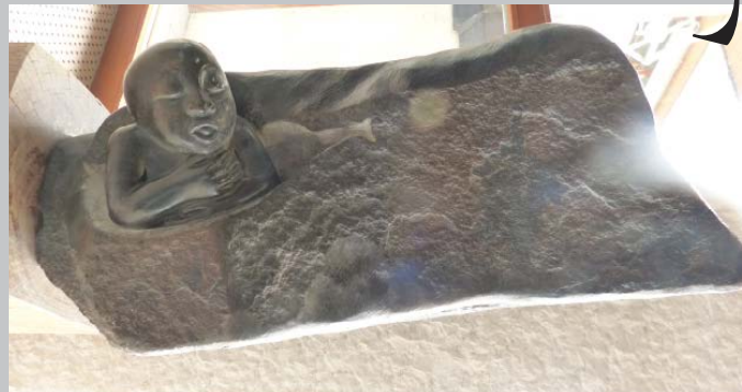
The Birth Die Geburt