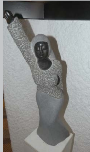
Safe with myMother Geborgen bei der Mutter