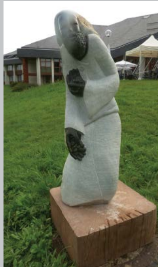
The Sower, Markus 4,1-9 Der Sämann, Markus 4,1-9