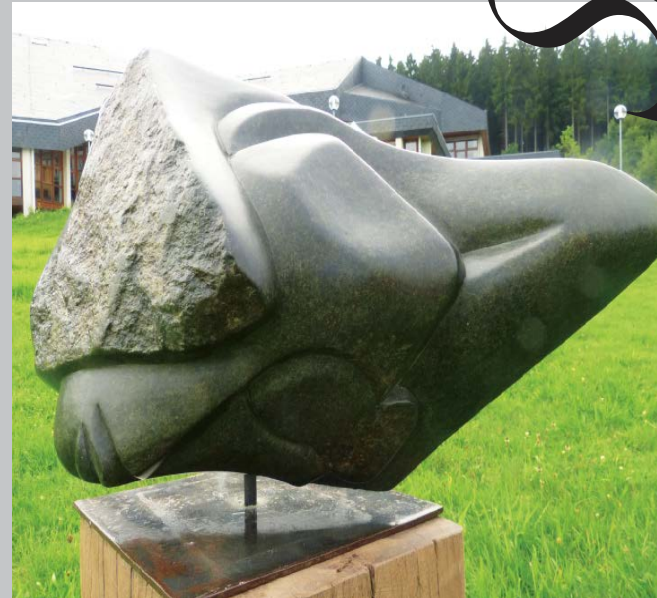
Feeling of a Troubled Person In Angst und Sorge