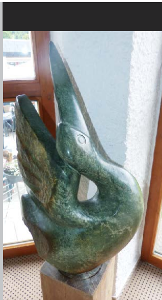
The Pelican Der Pelikan