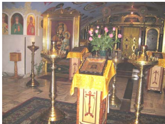
Besichtigung der polnisch-orthodoxen Kirche im Stadtteil Praga