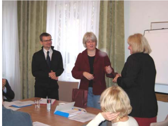
Dank an die Mitarbeiterinnen des PÖR für die engagierte Tagungsorganisation