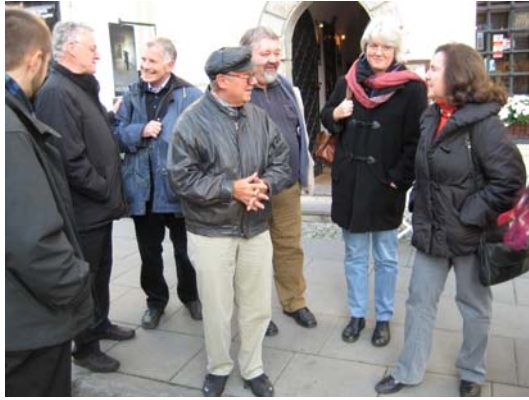
Exkursion durch die Warschauer Altstadt