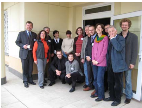
Gruppenfoto der TeilnehmerInnen des 2. europäischen Symposions