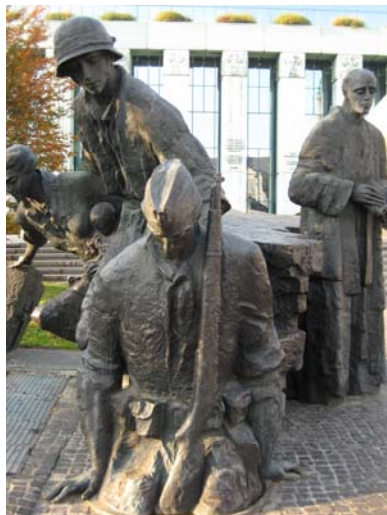
Denkmal für den Warschauer Aufstand 1944