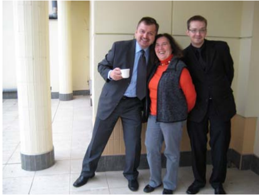
Kaffee und Gespräche auf der Terrasse während einer Konferenzpause