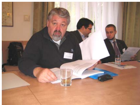
Materiallektüre während der Konferenz