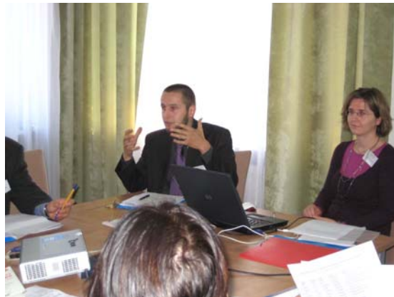
Der italienische Vortrag mit ungarischer Moderation