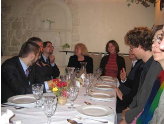
Mittagessen während einer Konferenzpause