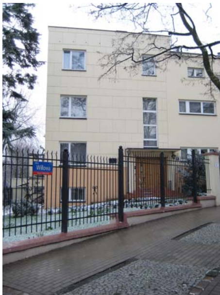
Sitz des Polnisch Ökumenischen Rates in Warschau