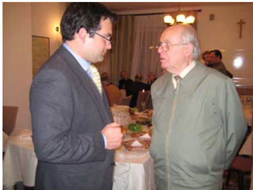
Italienisch-polnische Konversation während des Empfangs