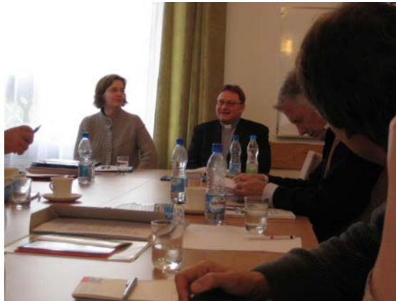
Der polnische Beitrag moderiert von einer ungarischen Teilnehmerin