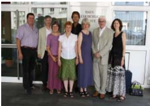
Die Delegation aus der Church of Scotland zu Besuch im Haus Landeskirchlicher Dienste/Dortmund

Zusammenarbeit mit der Church of Scotland nimmt nach Delegationsbesuch konkrete Formen an - Vom 24. bis zum 27. August weilte eine Delegation der Church of Scotland zu Besuch in der Ev. Kirche von Westfalen. Vorausgegangen waren erste Kontaktgespräche einer fünfköpfigen, westfälischen Delegation im Februar in Schottland.