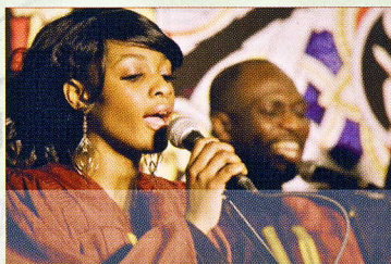
New Life Gospel Choir